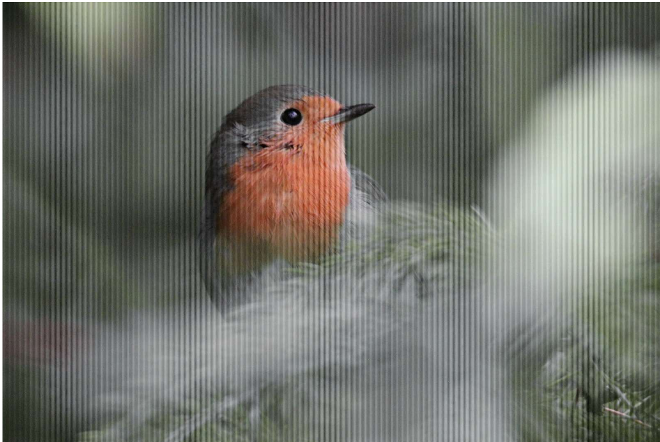
Vogel des Jahres 2025: Rotkehlchen