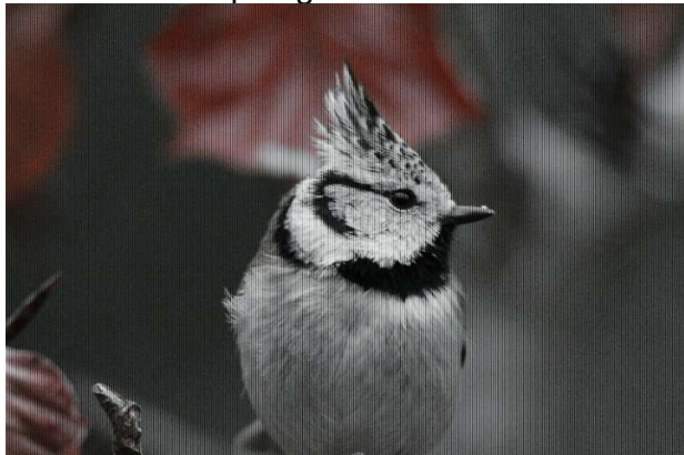
Haubenmeise