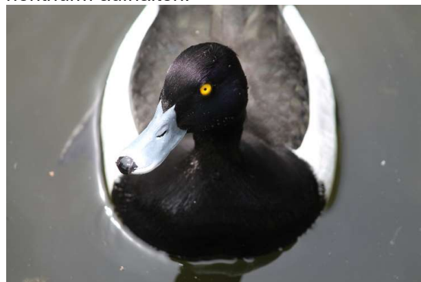
Reiherente