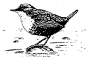
Natur - und Vogelschutzverein "Wasseramsel" Innenschwyz